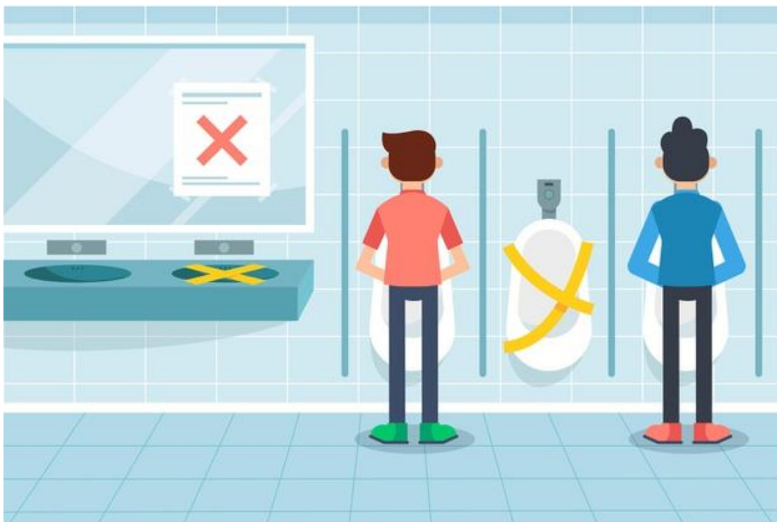
Ejemplo de prácticas para asegurar distanciamiento físico en urinario