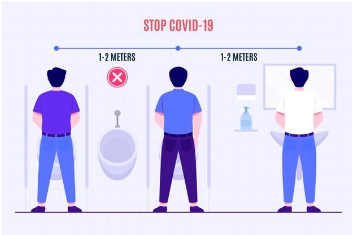
Ejemplo de prácticas para asegurar distanciamiento físico en urinarios