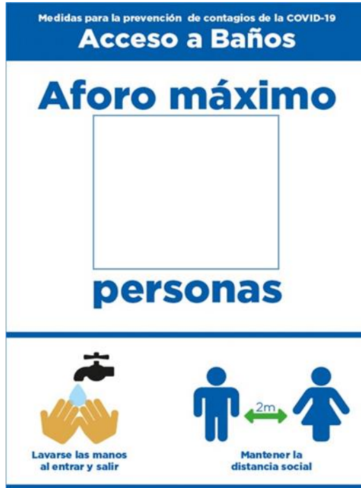
Ejemplo de señalética indicando aforo permitido